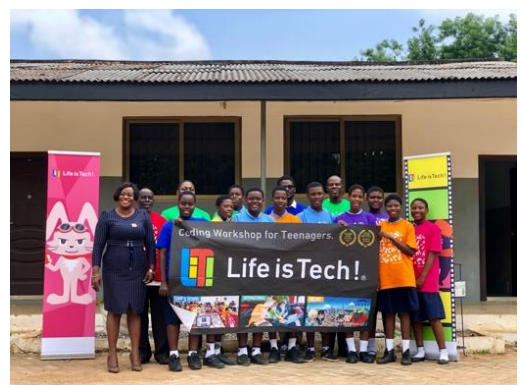
活動PR3 (200 文字以内)