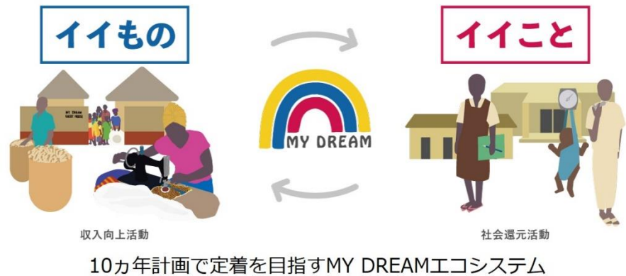
活動PR2* (200 文字以内)

私たちは、アフリカの真に持続可能な開発に寄与するような日本企業のアフリカ進出もサポートしています。オンラインでプログラミングを学ぶことができる教材の展開や、衛生環境を整えることに役立つ日本の技術を届けるなど、日本の強みを活かしてアフリカの発展の後押しに取り組んでいます。